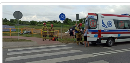
Miejsce zdarzenia drogowego