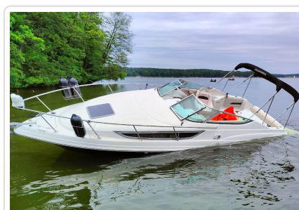
Uszkodzona łódź na wodzie