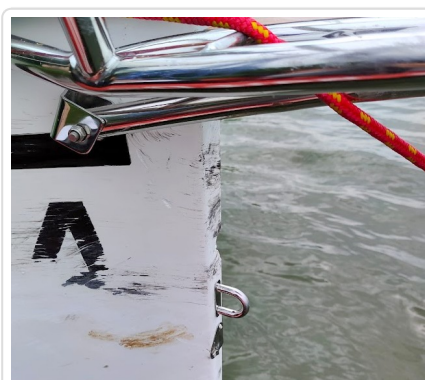
Uszkodzona łódź na wodzie