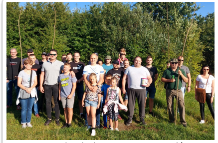
Uczestnicy i obserwatorzy zawodów