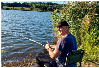
Pomysłodawca zawodów na stanowisku wędkarskim