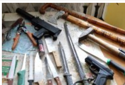
Znalezione noże i atrapy broni