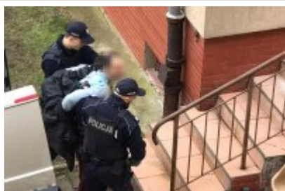
Zatrzymany mężczyzna prowadzony przez policjantów