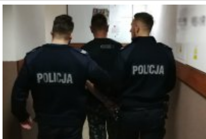
Zatrzymany mężczyzna prowadzony przez policjantów

Dalsze czynności realizowane w tej sprawie pozwoliły na przedstawienie kolejnego zarzutu innemu podejrzanemu o przestępstwa narkotykowe. Do zatrzymania 21-lątka doszło na terenie powiatu golubsko-dobrzyńskiego. Mężczyzna ten usłyszał zarzut udzielania narkotyków.