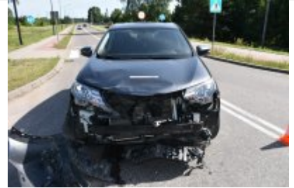
Miejsce zdarzenia drogowego w powiecie piskim