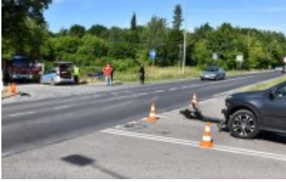
Miejsce zdarzenia drogowego w powiecie piskim