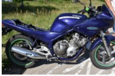
Miejsce zdarzenia drogowego w powiecie piskim