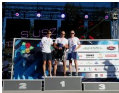
Zwycięzcy w kategoriach wiekowych