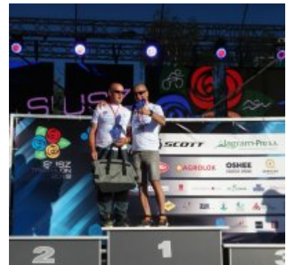
Policjanci uczestniczący w II Mistrzostwach Polski Policji w Triathlonie Susz 2019