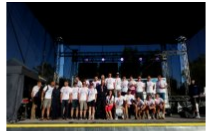
Policjanci uczestniczący w II Mistrzostwach Polski Policji w Triathlonie Susz 2019