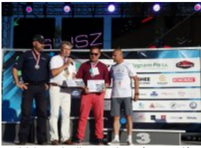
Podziękowania dla organizatorów zawodów