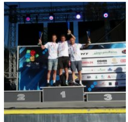
Zwycięzcy w kategorii open

Wyłoniono również zwycięzców w poszczególnych kategoriach wiekowych.