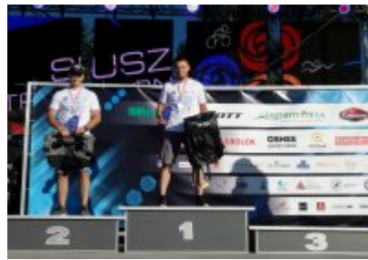
Policjanci uczestniczący w II Mistrzostwach Polski Policji w Triathlonie Susz 2019