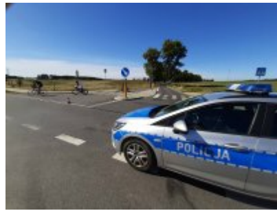
Radiowóz na trasie zawodów