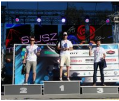
Policjanci uczestniczący w II Mistrzostwach Polski Policji w Triathlonie Susz 2019