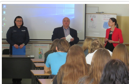
Inauguracja kampanii Narkotyki i dopalacze zabijają

O godzinie 11.00 w Zespole Szkół Ogólnokształcących nr 1 w Olsztynie, dzięki uprzejmości kadry kierowniczej oraz pedagogicznej szkoły, odbyła się wojewódzka inauguracja kampanii „Narkotyki i dopalacze zabijają”.