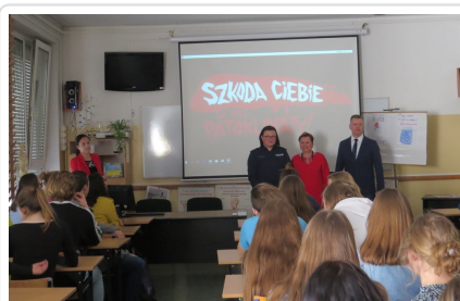
Inauguracja kampanii Narkotyki i dopalacze zabijają