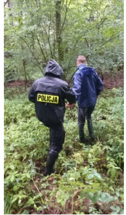
Policjanci podczas wykonywania czynności z zatrzymanym