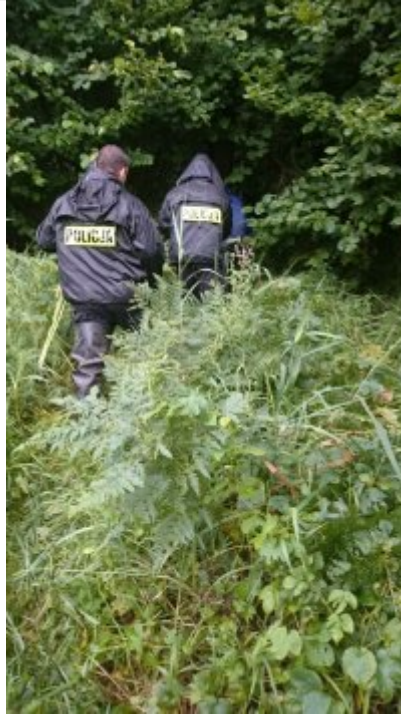
Policjanci podczas wykonywania czynności