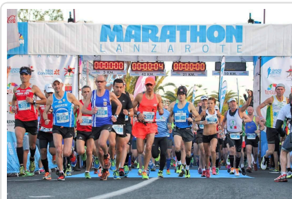
Zawody na wyspach kanaryjskich