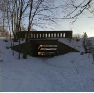
Miejsce, w którym spał mężczyzna