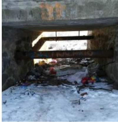
Miejsce, w którym spał mężczyzna