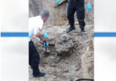
Miejsce zakopania ciała