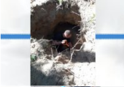
Miejsce zakopania ciała