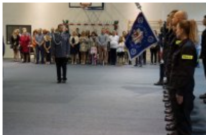
Uczestnicy uroczystego ślubowania policjantów

Przyjęci do służby rozpoczną półroczny kurs podstawowy w jednej z policyjnych szkół. Podczas szkolenia zostaną przygotowani do wykonywania odpowiedzialnej i trudnej pracy. Funkcjonariusze, pod okiem wykwalifikowanej i doświadczonej kadry dydaktycznej, wzbogacą swoją wiedzę na temat broni palnej, środków przymusu bezpośredniego, nauczą się wszelkich procedur wynikających z obowiązujących przepisów. Po zakończeniu kursu powrócą do swoich macierzystych jednostek, w których będą zdobywać doświadczenie.