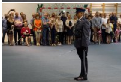
Uczestnicy uroczystego ślubowania policjantów