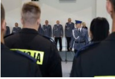
Uczestnicy uroczystego ślubowania policjantów

Po 2 osoby uzupełnią skład etatowy Oddziału Prewencji Policji w Olsztynie, Komendy Miejskiej Policji w Olsztynie, Komendy Miejskiej Policji w Elblągu, Komendy Powiatowej Policji w Bartoszycach, Komendy Powiatowej Policji w Szczytnie, Komendy Powiatowej Policji w Ostródzie, Komendy Powiatowej Policji w Ełku, po 1 funkcjonariuszu wzbogacą się Komendy Powiatowe Policji w Kętrzynie i w Nidzicy oraz Wydział Konwojowy KWP w Olsztynie.