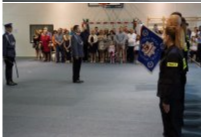
Uczestnicy uroczystego ślubowania policjantów