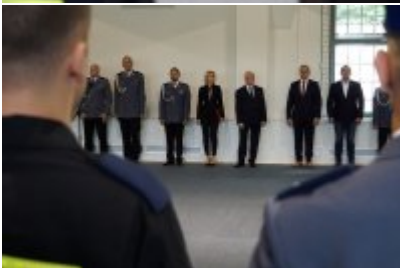
Uczestnicy uroczystego ślubowania policjantów