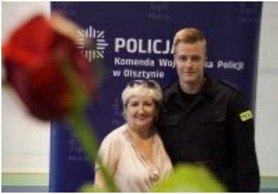
Uczestnicy uroczystego ślubowania policjantów