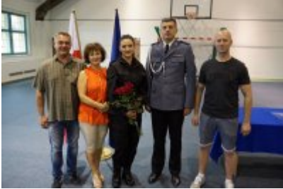
Uczestnicy uroczystego ślubowania policjantów