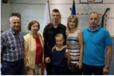
Uczestnicy uroczystego ślubowania policjantów