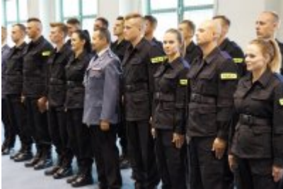
Uczestnicy uroczystego ślubowania policjantów