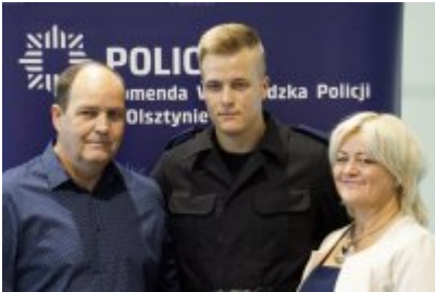
Uczestnicy uroczystego ślubowania policjantów