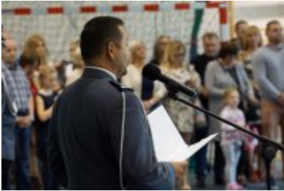
Uczestnicy uroczystego ślubowania policjantów