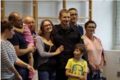
Uczestnicy uroczystego ślubowania policjantów