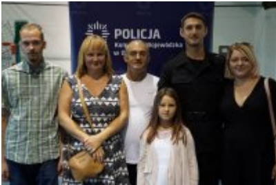
Uczestnicy uroczystego ślubowania policjantów