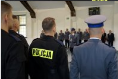
Uczestnicy uroczystego ślubowania policjantów