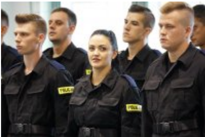
Uczestnicy uroczystego ślubowania policjantów