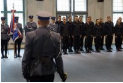
Uczestnicy uroczystego ślubowania policjantów