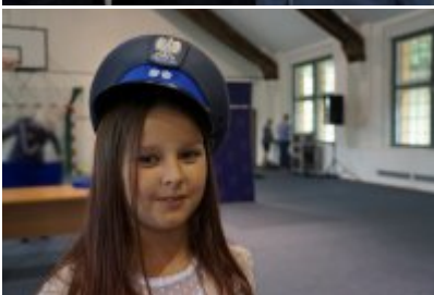
Uczestnicy uroczystego ślubowania policjantów