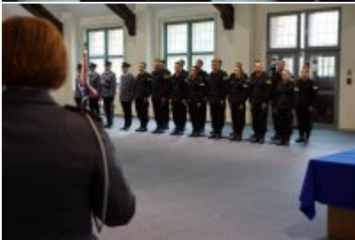
Uczestnicy uroczystego ślubowania policjantów