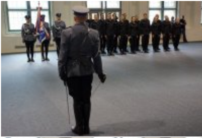
Uczestnicy uroczystego ślubowania policjantów