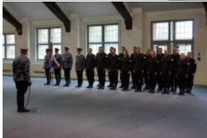
Uczestnicy uroczystego ślubowania policjantów