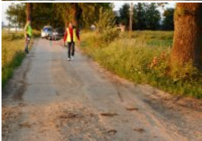
Miejsce wypadku drogowego na trasie Galiny - Trutnowo