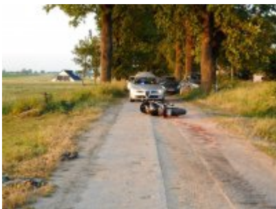
Miejsce wypadku drogowego na trasie Galiny - Trutnowo

Policjanci ruchu drogowego, którzy przyjechali na miejsce tego zdarzenia ustalili, że 27-letni motocyklista najechał na rozciągniętą przez drogę gumową linę. Została ona tam wcześniej umieszczona przez 60-letniego pracownika gospodarstwa rolnego, podczas przeprowadzania zwierząt przez drogę. Mężczyzna ten po przepędzeniu zwierząt na drugą stronę drogi zapomniał zdjąć linę, na którą wjechał kierujący motocyklem.