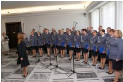
Chór Policji Garnizonu Warmińsko - Mazurskiego podczas wizyty w Senacie RP #21