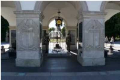
Chór Policji Garnizonu Warmińsko - Mazurskiego przy Grobie Nieznanego Żołnierza

Po uroczystości w Senacie Rzeczypospolitej Polskiej Warmińsko - Mazurscy policjanci oddali hołd poległym składając kwiaty przed Grobem Nieznanego Żołnierza oraz Pomnikiem Ofiar Tragedii Smoleńskiej 2010 Roku w Warszawie.