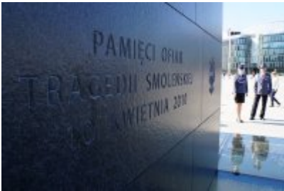
Chór Policji Garnizonu Warmińsko - Mazurskiego przed Pomnikiem Ofiar Tragedii