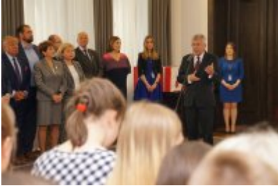
Chór Policji Garnizonu Warmińsko - Mazurskiego podczas wizyty w Senacie RP #6