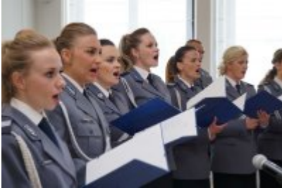
Chór Policji Garnizonu Warmińsko - Mazurskiego podczas wizyty w Senacie RP #10