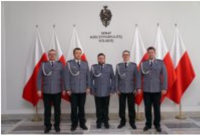
Chór Policji Garnizonu Warmińsko - Mazurskiego podczas wizyty w Senacie RP #4