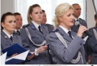
Chór Policji Garnizonu Warmińsko - Mazurskiego podczas wizyty w Senacie RP #17