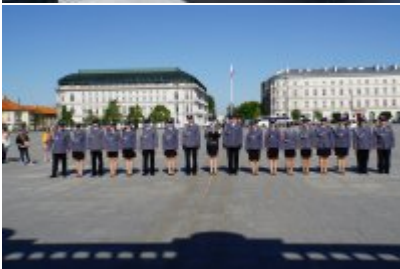
Chór Policji Garnizonu Warmińsko - Mazurskiego przy Grobie Nieznanego Żołnierza