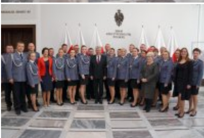
Chór Policji Garnizonu Warmińsko - Mazurskiego podczas wizyty w Senacie RP #25