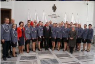
Chór Policji Garnizonu Warmińsko - Mazurskiego podczas wizyty w Senacie RP #24