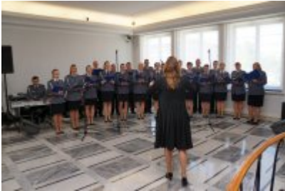
Chór Policji Garnizonu Warmińsko - Mazurskiego podczas wizyty w Senacie RP #9