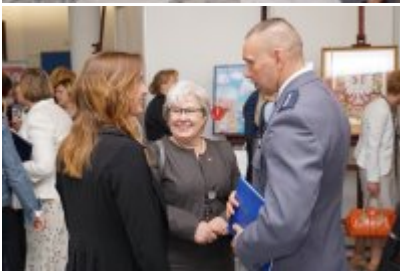
Senator RP Bogusława Orzechowska