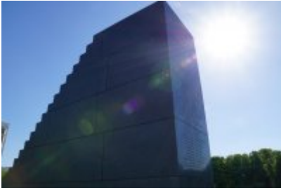
Chór Policji Garnizonu Warmińsko - Mazurskiego przed Pomnikiem Ofiar Tragedii