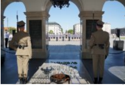
Chór Policji Garnizonu Warmińsko - Mazurskiego przy Grobie Nieznanego Żołnierza