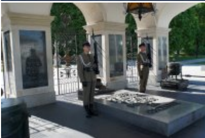
Chór Policji Garnizonu Warmińsko - Mazurskiego przy Grobie Nieznanego Żołnierza