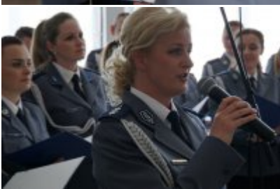
Chór Policji Garnizonu Warmińsko - Mazurskiego podczas wizyty w Senacie RP #50