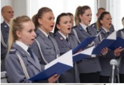
Chór Policji Garnizonu Warmińsko - Mazurskiego podczas wizyty w Senacie RP #53