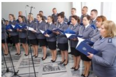
Chór Policji Garnizonu Warmińsko - Mazurskiego podczas wizyty w Senacie RP #1

Wczoraj (07.05.2018) w Senacie Rzeczypospolitej Polskiej odbył się uroczysty finał konkursu plastycznego "Orzeł Biały - nasza duma" pod patronatem marszałka Senatu Stanisława Karczewskiego. Tegoroczna edycja konkursu była częścią obchodów 100-lecia odzyskania przez Polskę niepodległości. Tematem prac było polskie godło, począwszy od czasów Mieszka I do czasów współczesnych. Celem przedsięwzięcia było zainteresowanie uczniów znaczeniem naszych symboli narodowych, a także popularyzacja wiedzy o godle. W wydarzeniu tym uczestniczył również Chór Policji Garnizonu Warmińsko - Mazurskiego. Funkcjonariusze wspólnie z zebranymi gośćmi zaśpiewali a capella Hymn Polski na rozpoczęcie spotkania. Następnie w holu Senatu Rzeczypospolitej Polskiej rozbrzmiały patriotycznie pieśni: "Warszawianka", "Przybyli Ułani", "Piechota", "Czerwone Maki" i "Pieśń Rycerzy Bolesława Krzywoustego" wykonane przez policjantów z Warmii i Mazur. Występowi Chóru Policji Garnizonu Warmińsko -Mazurskiego, przysłuchiwała się również jego współinicjatorka Senator RP Bogusława Orzechowska, która na wstępie zapowiedziała patriotyczny występ policjantów. Dzięki jej uprzejmości funkcjonariusze mogli także zwiedzić budynek Senatu RP.