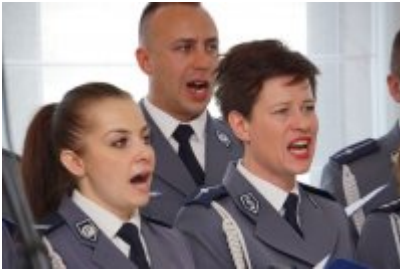
Chór Policji Garnizonu Warmińsko - Mazurskiego podczas wizyty w Senacie RP #15