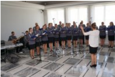
Chór Policji Garnizonu Warmińsko - Mazurskiego podczas wizyty w Senacie RP #41