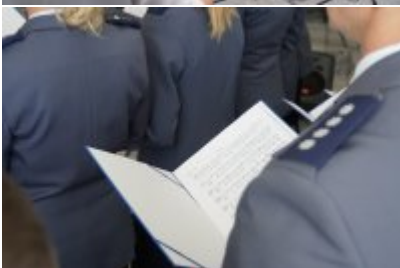
Chór Policji Garnizonu Warmińsko - Mazurskiego podczas wizyty w Senacie RP #46