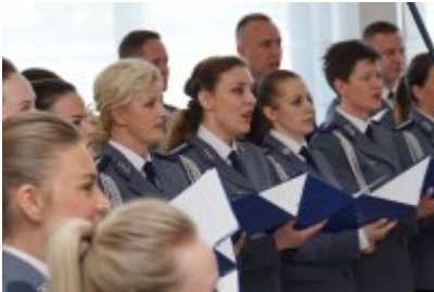
Chór Policji Garnizonu Warmińsko - Mazurskiego podczas wizyty w Senacie RP #14