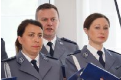
Chór Policji Garnizonu Warmińsko - Mazurskiego podczas wizyty w Senacie RP #19