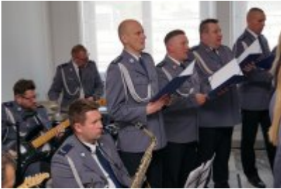
Chór Policji Garnizonu Warmińsko - Mazurskiego podczas wizyty w Senacie RP #56

Po uroczystości w Senacie Rzeczypospolitej Polskiej Warmińsko - Mazurscy policjanci oddali hołd poległym składając kwiaty przed Grobem Nieznanego Żołnierza oraz Pomnikiem Ofiar Tragedii Smoleńskiej 2010 Roku w Warszawie.