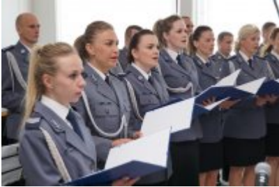
Chór Policji Garnizonu Warmińsko - Mazurskiego podczas wizyty w Senacie RP #40