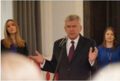
Marszałek Senatu RP Stanisław Karczewski