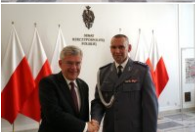
Marszałek Senatu RP Stanisław Karczewski