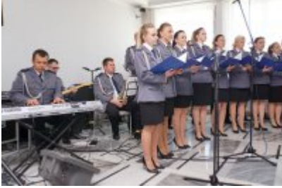
Chór Policji Garnizonu Warmińsko - Mazurskiego podczas wizyty w Senacie RP #54