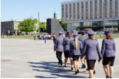
Chór Policji Garnizonu Warmińsko - Mazurskiego przed Pomnikiem Ofiar Tragedii