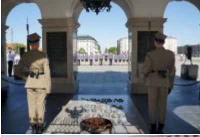
Chór Policji Garnizonu Warmińsko - Mazurskiego przy Grobie Nieznanego Żołnierza