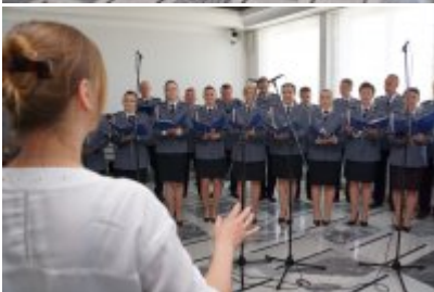
Chór Policji Garnizonu Warmińsko - Mazurskiego podczas wizyty w Senacie RP #42