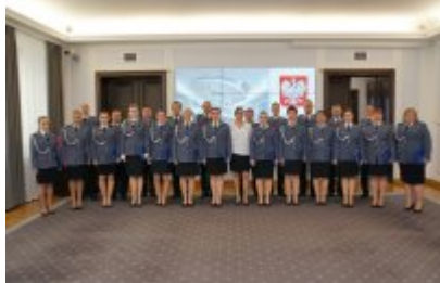
Chór Policji Garnizonu Warmińsko - Mazurskiego podczas wizyty w Senacie RP #3