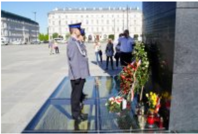
Chór Policji Garnizonu Warmińsko - Mazurskiego podczas wizyty w Sejmie RP #34