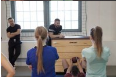
Dzien Kandydata - 17.03.2018 #19