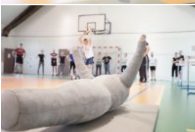
Dzien Kandydata - 17.03.2018 #10