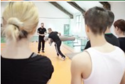
Dzien Kandydata - 17.03.2018 #8