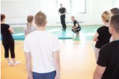
Dzien Kandydata - 17.03.2018 #13