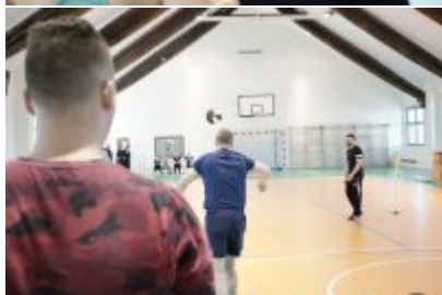
Dzien Kandydata - 17.03.2018 #24