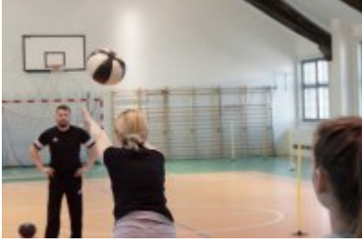
Dzien Kandydata - 17.03.2018 #5