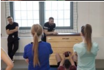
Dzien Kandydata - 17.03.2018 #19