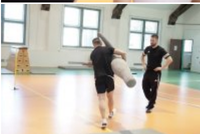
Dzien Kandydata - 17.03.2018 #9