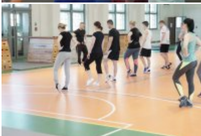
Dzien Kandydata - 17.03.2018 #20