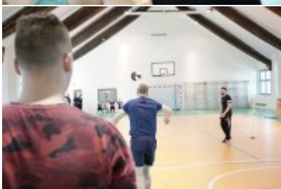
Dzien Kandydata - 17.03.2018 #24