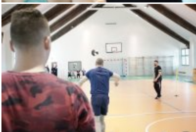
Dzien Kandydata - 17.03.2018 #24