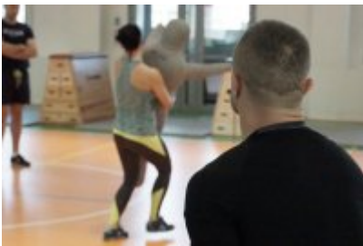
Dzien Kandydata - 17.03.2018 #1