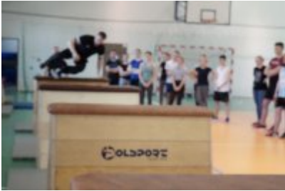
Dzien Kandydata - 17.03.2018 #6