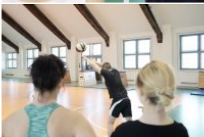
Dzien Kandydata - 17.03.2018 #23