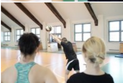
Dzien Kandydata - 17.03.2018 #23