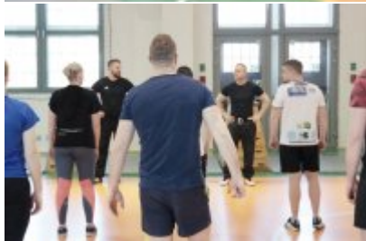
Dzien Kandydata - 17.03.2018 #21