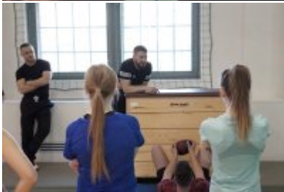
Dzien Kandydata - 17.03.2018 #19