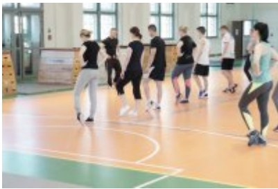
Dzien Kandydata - 17.03.2018 #20