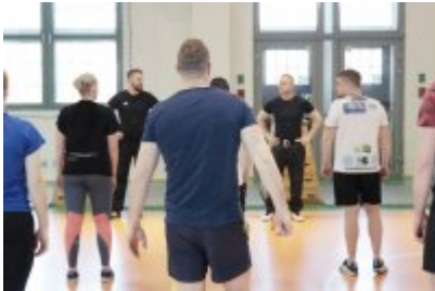
Dzien Kandydata - 17.03.2018 #21