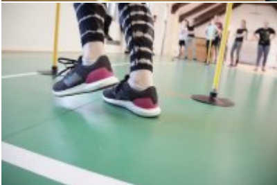
Dzien Kandydata - 17.03.2018 #3