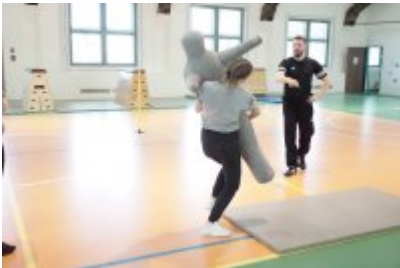
Dzien Kandydata - 17.03.2018 #7