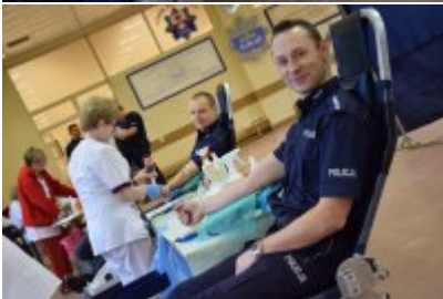
Akcja "SpokREWnieni" w Mrągowie