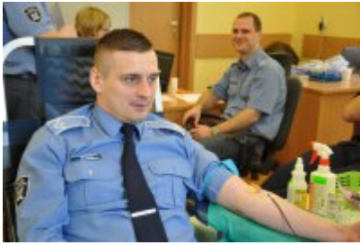
Akcja "SpoKREWnieni" w Nidzicy