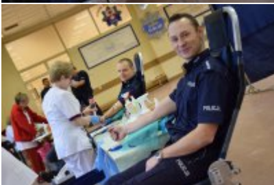
Akcja "SpokREWnieni" w Mrągowie