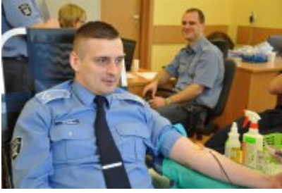
Akcja "SpoKREWnieni" w Nidzicy