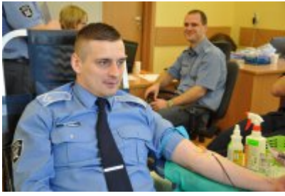
Akcja "SpoKREWnieni" w Nidzicy