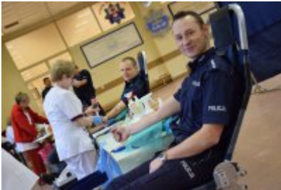
Akcja "SpokREWnieni" w Mrągowie