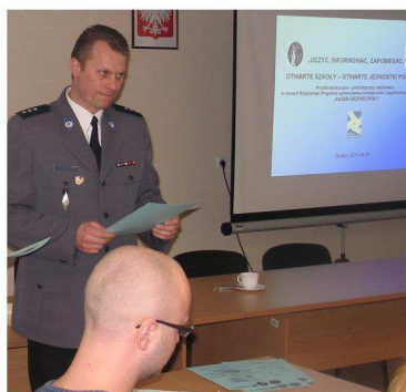
2011 - szkolenie nauczycieli