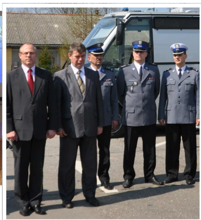
2011 r. - uroczyste przekazanie nowoczesnego sprzętu, w tym łodzi i motocykli

- Jeśli chodzi o dzielnicowych, to do tej zmiany przygotowaliśmy się od 2016 roku. Już wtedy była informacja o zmianie przepisów o pracy dzielnicowych, a w tym, głównie, na co wszyscy dzielnicowi czekali – odciążenia ich od pracy biurowej, od prowadzenia postępowań w sprawach o wykroczenia, co stało się faktem z dniem 1 stycznia 2017 roku.