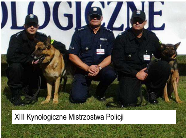
XIII Kynologiczne Mistrzostwa Policji

40%- niż w pierwszym kwartale 2016 roku. 311 zostało rannych, to mniej o blisko 30. Policjanci odnotowali ponad 3700 kolizji drogowych - to o ponad 400 więcej niż w analogicznym okresie 2016 roku. Najczęstszą przyczyną wypadków było niedostosowanie prędkości do warunków panujących na drodze, a najgorszymi miesiącami w ruchu drogowym są miesiące letnie, gdy w naszym województwie przebywa bardzo dużo turystów z kraju i zza granicy.