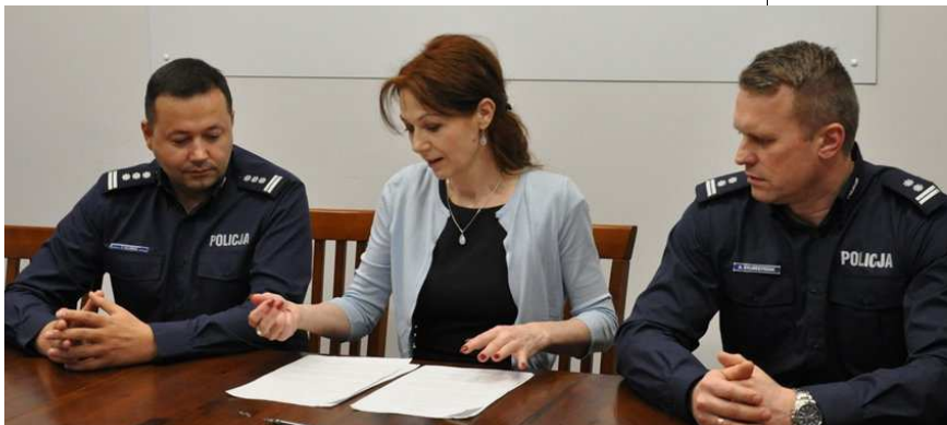
Podpisanie porozumienia o współpracy z Krajową Administracją Skarbową

Od 15 kwietnia w Wydziale Prewencji KWP w Olsztynie zatrudniona będzie policjantka, która przeszła do nas z KMP w Szczecinie. Posiada ona wiedzę i przeszkolenie z zakresu służby na wodzie. Jest również przewodnikiem psa służbowego przeszkolonego z zakresu wyszukiwania zapachu zwłok ludzkich na lądzie i wodzie.