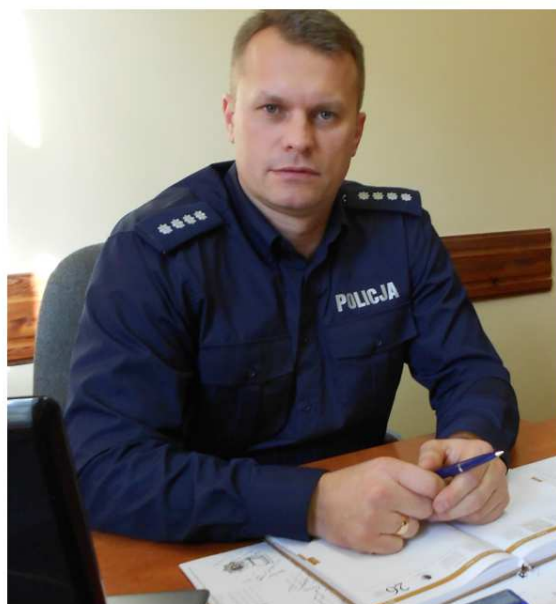
2012 r. - awans na stanowisko Naczelnika Wydziału Prewencji KWP w Olsztynie

Ważnym elementem pracy dzielnicowych jest popularyzacja Krajowej Mapy Zagrożeń Bezpieczeństwa, której funkcjonowanie wpływa na utrzymanie wysokiego poziomu bezpieczeństwa.