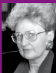
Ewa Łętowska 1987-1992