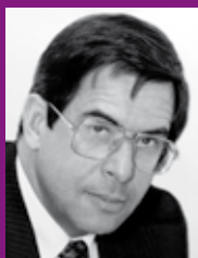
Andrzej Zoll 2000-2006