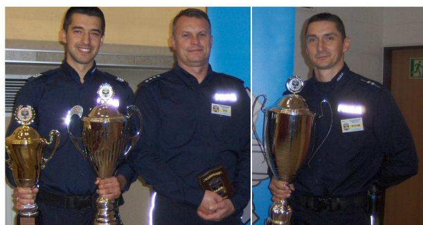
2014 r. – sukcesy warmińsko-mazurskich dzielnicowych w finale konkursu „Dzielnicowy Roku”