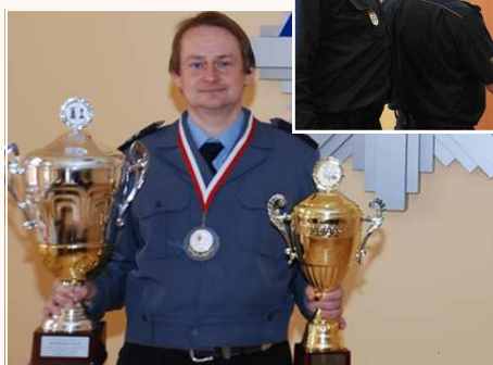
Z roku na rok powiększa się kolekcja pucharów!